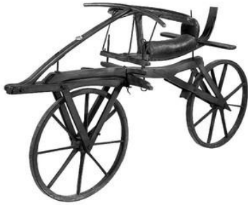
Die Laufmaschine von Karl Friedrich Freiherr Drais von Sauerbronn. München, Deutsches Museum, é.n., URL: http://www.deutsches-museum.de/sammlungen/meisterwerke/meisterwerke-v/laufmaschine/ Utolsó letöltés: 2017.01.12.

1817 eseményei között kutakodva egy különös járgány képére lelsz. Ismerős számodra, de valami mégsem ugyanolyan. Keresel mai képet is róla és azt látod, hogy a bicikli fejlődése 200 év után sem áll meg.