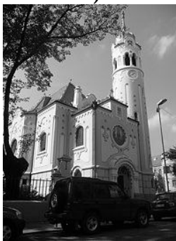
Kék templom, Pozsony