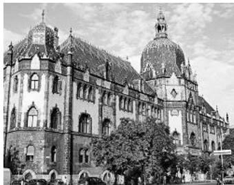
Iparművészeti Múzeum, Budapest