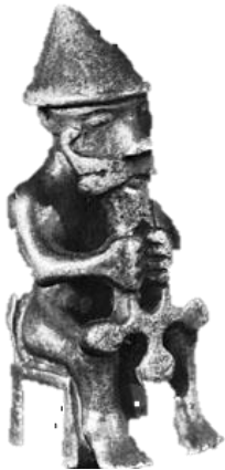
Kép: Thor isten X. századi bronz szobra az Izlandi Nemzeti Múzeumban.